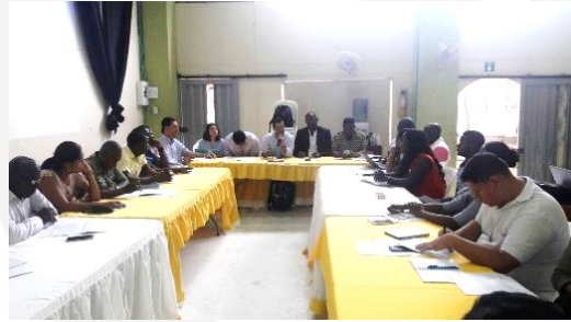
Consejo Territorial de Paz