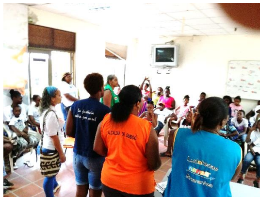
Jornada de articulación interinstitucional para prevención del Trabajo Infantil