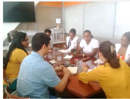
Coordinación con OIM y SENA – Proyecto de Discapacidad