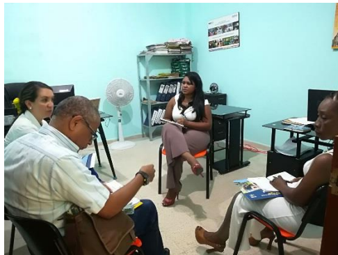
Articulación con Corporación Minuto de Dios