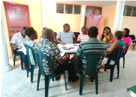
Reunión con Asocomunales