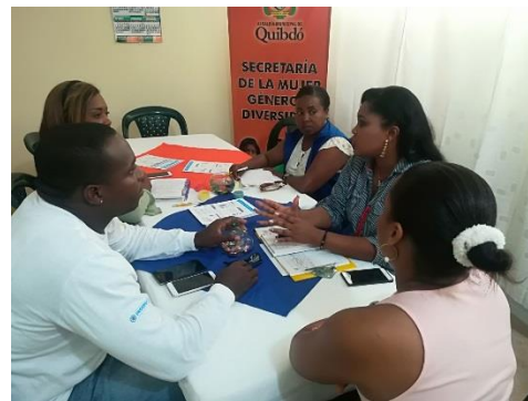
Coordinación con Red Unidos