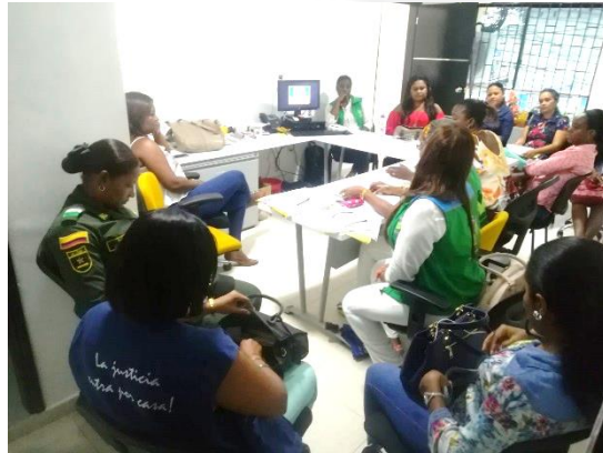
Reunión Comité Intersectorial para la Erradicación del Trabajo Infantil – CETI