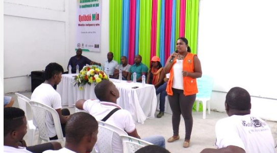
Lanzamiento torneo por la seguridad, la inclusión social y la convivencia