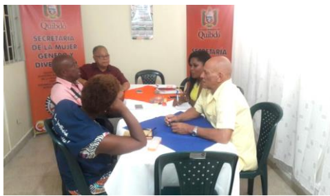
Coordinación con Asociación del Adulto Mayor